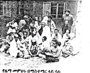
የዚግ ምምህር በግስተግር ላይ ላለ

ውስጥ በትጋት ይሠራሉ። ይህ እንቅስቃሴ ወደ ፊት ለቤተ ክርስቲያን መጠናኛ ገቢ የሚያስገኝ ከመሆኑም ሌላ የአካባቢውን ተመጋቢ ሕዝብ ችግር በመጠኑ እንዲሟያቃልል ተስፋ ይጣልበታል።