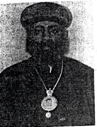
ብዕዕ አቡነ ጎርጎርዮስ ፣ ኤ.ም. ኤ