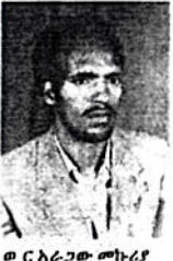
ወ. ሮ. አርጋው መኮርያ