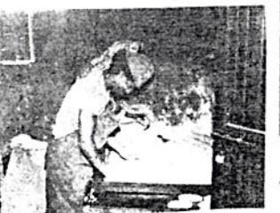
የዳግ መገሪያው ከፍል

መልአክ ፀሐይ፡- አዲስ መመሪያ በቃለ ዓዋቂው ከወጣ ጀምሮ በርከት ያሉ የልማት እንትስ ቃሴዎች ይካሄዳሉ። ለምሳሌ ከላውጡ ወዲህ፡- የቤተ ክርስቲያን ዐውደ ምሕረት በአስፋልት ተነጥሮአል። የቤተ ክርስቲያን ቅጥር ግቢ ጠባብ ስለነበርሰፊ ሆኖ እንዲሠራ ተደርጎአል። ቤተ ልሔሙ በዘመናዊ አሠራር ተሠርቶአል እንደዚሁም ለዩ ለዩ ቅርሳቅርሶችንና ንዋያተ ቅድሳትን በጥሩ ሁኔታ ለመጠበቅ ይቻላል ዘንድ ትልቅ ቤት ተሠርቶ በአገልግሎት ላይ ይገኛል። ይህ ሁሉ እኔ ከመምጣቱ በፊት የተፈጸመ የሥራ ውጤት ነው።