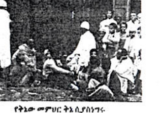
የቅዱስ ምምህር ትእሊፍ ሰነግሮ

ዲያ ተለምዶ በመሠረት ት/ቤተ 4 ክፍሎች ሲኖሩት አራት የትምህርት አይነቶች ይሰጡበታል።