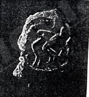
የአዳምና ሔዋን ግለት ም

ቅርጽ ዛሬ በፔንሲልቫንያ የደቡብ ሰሜን-ምሥራቅ (አሚሪካ) ይገኛል ። ከእነዚህም በስተቀር በዚሁ ምድር ከጥፋት ውሃ በፊት ከነበሩት የከተማ