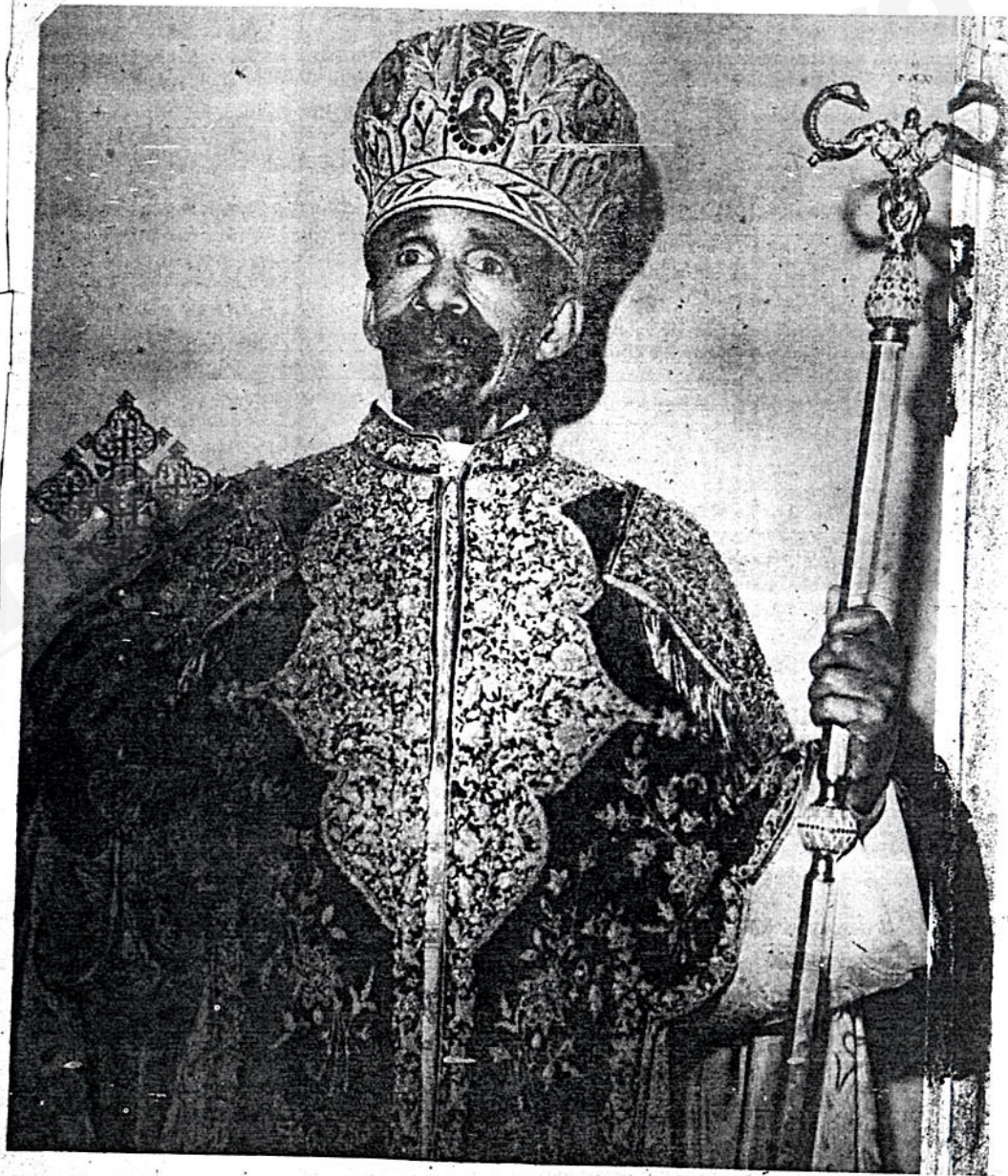
የብፁዕ ወትዳሰ አቡነ ተክለሃይማኖት የኢትዮጵያ ለርቶዶክስ ተዋሕዶ ቤተ ክርስቲያን ፓትርያርክና የትዳሰ ሲኖዶስ ሊቀ መንበር ፻፶ ዓመት በዓለ ሚ.መት በጸሎትና በታላቅ ሥነ ሥርዓት ነሐሴ ፳፫ ቀን ፲፱፻፸፪ ዓ.ም. በመንበረ ፓትርያርክ ትድስተ ቅዱሳን ማርያም ይከበራል።