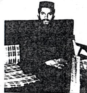
ሕንጻው ከሆነ ፍብር ሻኪ

ከ14 የጸም ተናት በኋላ በ15ኛው ቀን በዓል ፍልሰት ይከበራል ነሐሴ 15 ቀን ረቡዕ ወይም ዓርብ ቢሆን ስለ ክብር በዓል ፍልሰት ጸም መሆኑ ተርቶ 4 ሲካሆን ይውላል = ለደትና ጥምቀት በረቡዕና በዓርብ ቢውሉ እንደግደጃም ሁሉ በዓል ፍልሰታም እንዲሁ ነው = በ1947 ዓ.ም. የተገኘው የሕንድ የ19 ነት በዓል ነሐሴ 15 ቀን ነው = በአገር ጣሚ በዓል ፍልሰታ ከዚህ የነፃነት በዓል ጋር በዕለት ስለተባበረ በሕንድ ብሔራዊ በዓል ሆኖ ይውላል” ብለዋል = የእመቤታችን የቅድስት ድንገል ግርያም በዓል ፍልሰት ከሕንድ የነፃነት