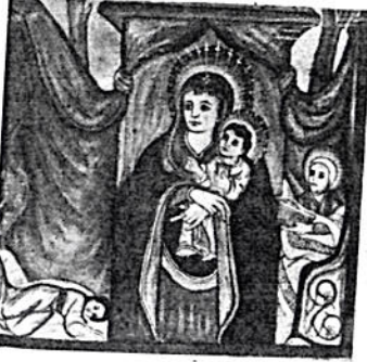
ዘለግለግደት ድንግል ግርዮም

ከብሉይ ኪዳን በፊት በዚህ ሕግ የተመሠረተ ድንግልናዋ ሕይወት መኖር አለመኖሩ ግልጽ ሆኖ አይታወቅም ቢብሉይ ኪዳን ግን አልፎ አልፎ በሆነ ክንብያት እንደ እነ ኤልያስ እንደ እነ የሐንስ መጥምቅ ያሉ ደናግል ነበሩ። ስለ ሴቶች ደናግል በብሉይ ኪዳን ተደጋግሞ የሚነገረው ባል እስኪያገቡ ድረስ ያሉትን ልጅገረዶች ብቻ ነው። የጋብቻ ዕድሜያቸው ደርሶ ያገባሉ፣ ደናግል መባላቸውም ይቀራል ። ከዚህ በቀር በብሉይ ኪዳን በድንግልና መላ ዘመናቸውን ስለኖሩ ሴቶች የተጻፈ የለም (Virgo Intacto) (ሸርጌንታክቶ) በአሳይያስ 7:14 ላይ “እነሆ ድንግል ትህንሳለች ወንድ ልጅንም ትወልዳለች፣ ስሙንም አግኝቷል ትለዋለች” ተብሎ ትንቢት የተነገረላት ቅድስት ድንግል ግርዮም ግን በስምም በግለግደት ከእነዚህ የተለየች ናት፣ ዘለግለግደት ድንግል ናትና ። ለቃውንትም ቅድመ ሀይስ ጊዜ ሀይስ ድንገረ ሀይስ ቅድመ ወለድ ጊዜ ወለድ ድንገረ ወለድ ድንግል መሆንን መስከረውላታ ። ድንግል ግርዮም ለደናግል በግይስ ግግ ጠባይ እናትነትዋ ሲነገር ለወላጅች በግይስግግ ጠባይ ደግሞ ያለ ተፈትሐ መውለድዋ ዕቡብ ይባላል። ልጅዋ