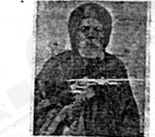
ብፁዕ አቡነ አብርሃም እኒህ ነበሩ

ገለዋል። በአስተዳዳሪነት ያገለገሉባቸው ገዳማትና አድባራትም የሚከተሉት ናቸው፡- 1ኛው ዋር ኪዳነ ምስረት ወሎ 2ኛው የሰባ ግርያም ወሎ ፣ 3ኛው ገረገራ ጊዮርጊስ ወሎ 4ኛው የላሊበላ አብያተ ክርስቲያናት ወሎ ፣ 5ኛው አንኮበር ሚካኤል ሸዋ ፣ 6ኛው ፍርኩታ ኪዳነ ምስረት ሸዋ ፣ 7ኛው መንበረ መንግሥት ገብርኤል አዲስ አበባ ናቸው ። ከዚህም ላይ ራስ ወሎ በሚያስተዳድሩት አገር ሁሉ ሊቀ ካህናት ሆነው አስተዳደረዋል በዚህም ጊዜ ሁሉ ጉባኤያቸው አልታጠፈም ነበር በመንበረ መንግሥት ገብርኤል በነበሩ ጊዜ ለንግሥት ዘውዲቱ ምኒልክ ትርጓሜ የሚያሰሙ እርሳቸው ነበሩ ።