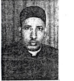
ካቶሊካዊው ካህን አባ ዘካርያስ

1ኛ/ በኢትዮጵያ የግሪክ ኦርቶዶክስ ቤተ ክርስቲያን ሊቀ ጳጳስ የሆኑት ብዕራ አቡነ ጴጥሮስ ስለጸም የሚከተለውን አስተያየት ሰጥተዋል። በኦርቶዶክስ ቤተ ክርስቲያን ያሉ ሊቀ ጳጳሱ ጸመ